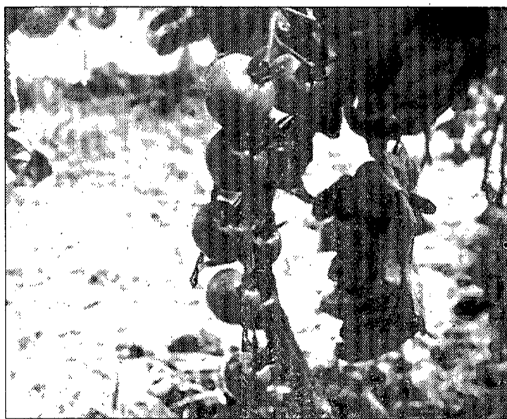
Los mercados tienen poco producto para comercializar

En cuanto a lo que resta de campaña de pimiento, Antonio Callejón afirma que el rojo debe mantenerse en los precios actuales, principalmente porque no tiene competidores y porque se están ofreciendo unos productos excelentes para vender. El pimiento verde tal vez se vea afectado por la competencia del pimiento holandés que comienza su producción. "De todas formas los mercados están vacíos,